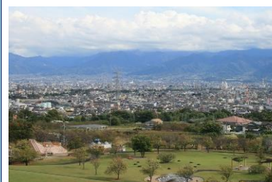
ドラゴンパーク展望塔から

10:00 JR竜王駅北口駅前広場 10:15 ほどよい田舎暮らし街並み参観 公園、病院、商業施設等見学 10:55 空き家バンク見学 物件① 11:35 「やはたいも」を使った 「いも煮汁」づくり体験(昼食) 新規就農者体験談 @甲斐敷島梅の里クインガルトン 14:05 空き家バンク見学 物件② 14:30 ドラゴンパーク散策 15:00 甲斐の人気イタリアンで ティータイム 移住者体験談 @セゾン ローゼ 16:10 美郷とたまご村 甲斐市の味をおみやげに 16:50 竜王駅北口駅前広場