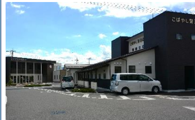
メディカルタウン